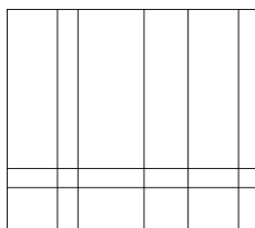
Figur 1: Problem 3